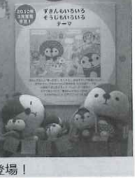
「きれいずきん生活」は、拭き掃除が得意な青ずきんが新登場!

な雑貨や可愛いぬいぐ るみが登場する。 新キャラクターの 「いいわけん」他、人 気キャラたちの春先ま での展開が示された。