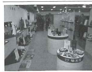
文具も五感に訴える時代へ

した。売上目標は、上 代で2億円。昨年より 東京、札幌の2会場で 開催しており、今年も 前年同様に11月12日に 札幌でも開催する。 提案コーナーとし て、「今が旬!6つの 提案」を実施。手帳の おまけ、オフィスグ リーンなど、切り口を 変えて普通の文具をよ り美しく見せた。 昨年也好評だった 「桜のコーナー」は