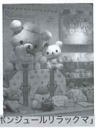
「ボンジュールリラックマ」

10月22、23日、サン エックス(東京都千代 田区)は、キャラクター ズフェアを行った。 リラックマは、10年 2月上旬に発売の「ポ ンジュールリラック マ」を紹介。フランス へ旅立つのかと思いき や、夢を見てました、 というオチがつく。ト リコロルカラーと エッフェル塔のモチー フを使用したフレンチ