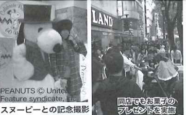
PEANUTS © United Feature syndicate, Inc. スノーピーとの記念撮影 同店でもお菓子の プレゼントを実施

スノーピー60歳を記念した ケイスポットでの展開 が行われている。25日 には、スノーピーとの 記念撮影会も実施した。 パレードとスノー ピーとのWの行列。原 宿を訪れた人たちは、 みんな笑顔になった。