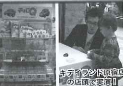
キタ省エネ原宿店 の店頭で実演!!

「チョロQ」は、『2009-2010 日本カー・オブ・ザ・イヤー 選考委員特別賞』も受賞!!